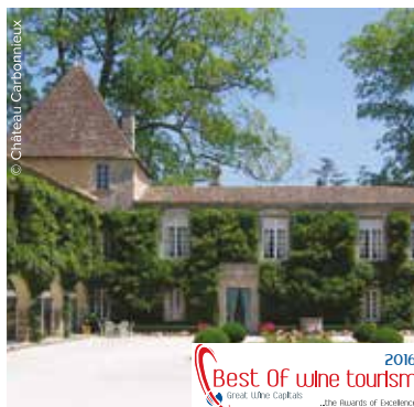
Château Carbonnieux - Chemin de Peyssardet 33850 Léognan 05 57 96 56 20 www.carbonnieux.com